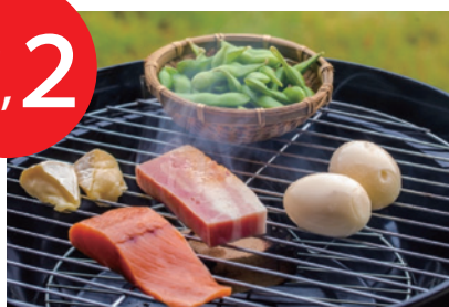
スモークセット (冷燻) 2人前 (サーモン・カマンベールチーズ ・自家製ベーコン・ゆで卵・枝豆) 2,500円