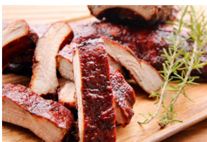
ポークバックリブ (スペアリブの背中側) 1ピース 650円