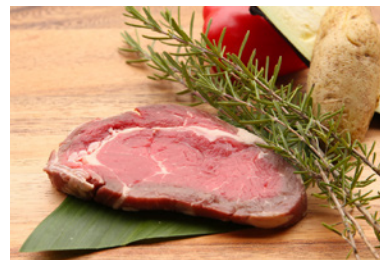
牛ロースステーキ (200g) 2人前 2,100円