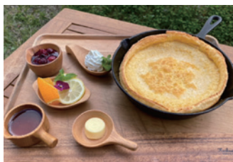
パンケーキ (2~3人前) 1,050円