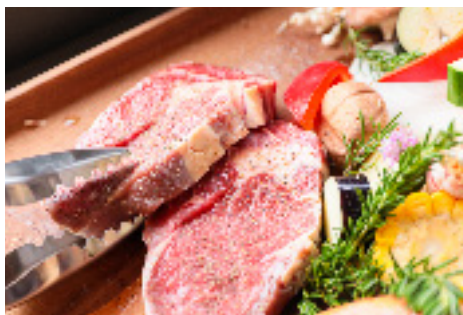
赤崎牛サーロインステーキ (300g) 4人前 6,300円