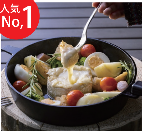
カマンベールチーズフォンデュ (2~3人前) (野菜・じゃがいも・ウインナー・フランスパン ・トマト・たまご) 1,900円