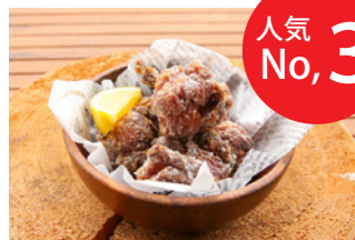
塩麴唐揚げ (5個) 650円