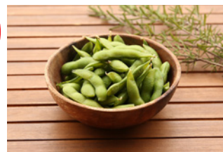
枝豆 (200g) 550円