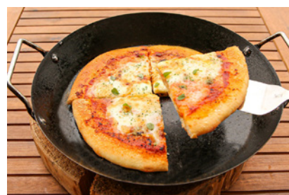
ピザマルゲリータ (約21cm) 1,500円