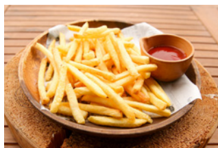
フライドポテト 550円