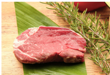
牛ヒレ肉ステーキ (200g) 2人前 3,200円